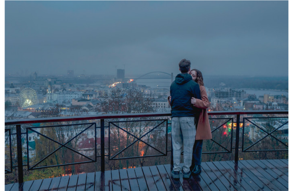
« À Kiev, les coupures de courant sont fréquentes à cause des frappes russes sur les infrastructures énergétiques. Malgré cela, les jeunes continuent de vivre et

sortir dehors ou dans des bars. Être reporter de guerre, c'est aussi montrer la vie des gens, comme ce jeune couple qui s'embrasse, le 6 novembre 2022. »