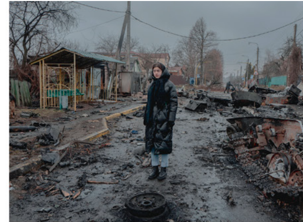
« J'ai fait cette photo le 2 mars 2022. On y voit une Ukrainienne constater les dégâts des frappes de drones de l'armée ukrainienne contre une colonne de blindés russes, le 27 février 2022, à Boutcha. Deux jours après, la ville était occupée et les exactions contre la population ont commencé. J'ai essayé de retrouver cette jeune fille mais personne n'a su me dire comment elle s'appelait. »

R. : J'ai été envoyé plusieurs fois en Ukraine par le journal Le Monde pour des missions d'un mois. Je travaille en binôme avec un journaliste qui écrit les textes. Nous avons aussi un chauffeur et un fixeur. Souvent, les lecteurs ne connaissent pas les fixeurs. Pourtant, ils sont essentiels :