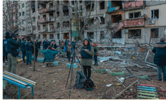
« J'ai photographié ces journalistes devant un bâtiment résidentiel détruit par une frappe russe, au nord de Kiev, le 14 mars 2022. Des milliers de reporters du monde entier sont venus documenter la guerre en Ukraine. Je les fuis, je préfère être seul et de ne pas être là où tout le monde se trouve. »

R. : Nous sommes accrédités par le ministère de la Défense ukrainien. Cela nous permet de nous déplacer