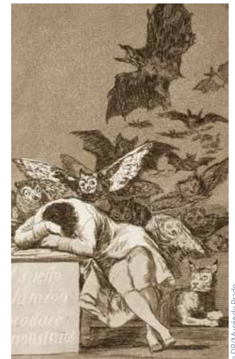
Le sommeil de la raison engendre des monstres, gravure issue de Los Caprichos , une série de 80 gravures de Francisco de Goya.

Ces ressources sont aussi spécifiquement adaptées au monde contemporain et à nos citoyens et citoyennes en herbe. Les revues dont sont extraits les supports tra-