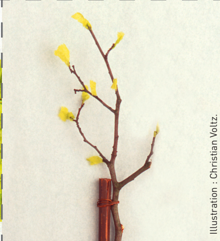
Illustration : Christian Voltz.