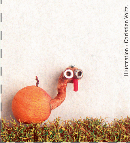
Illustration : Christian Voltz.