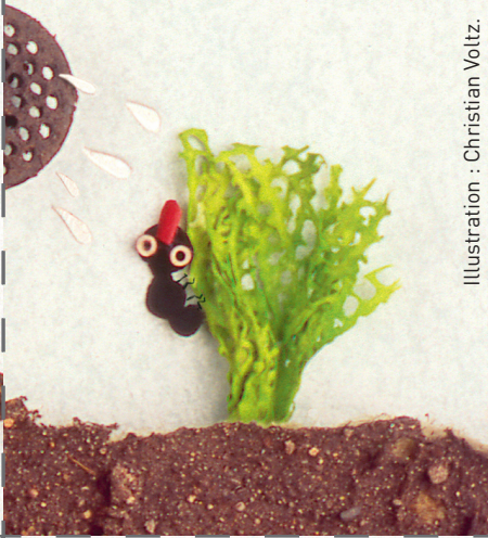
Illustration : Christian Voltz.