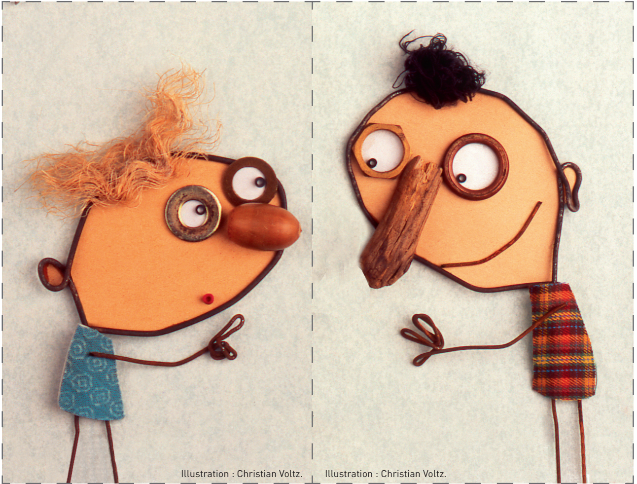
Illustration : Christian Voltz.