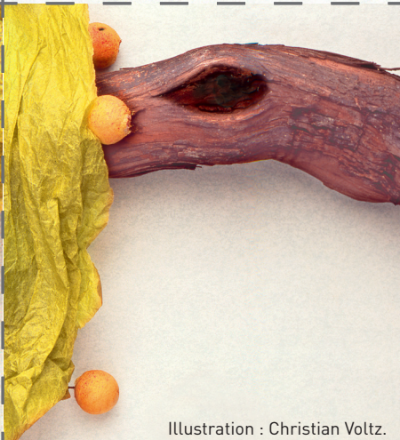
Illustration : Christian Voltz.