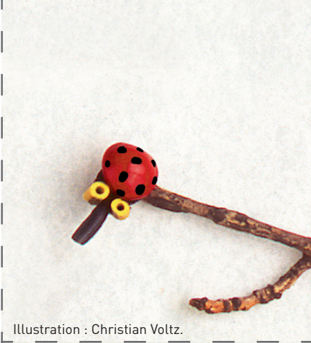
Illustration : Christian Voltz.