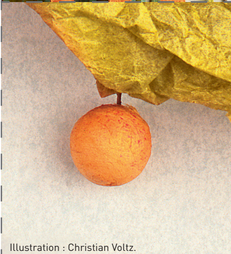
Illustration : Christian Voltz.