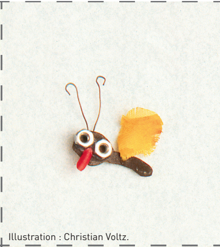
Illustration : Christian Voltz.