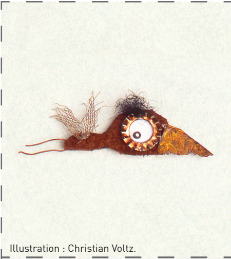
Illustration : Christian Voltz.