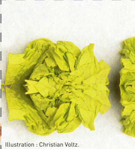
Illustration : Christian Voltz.