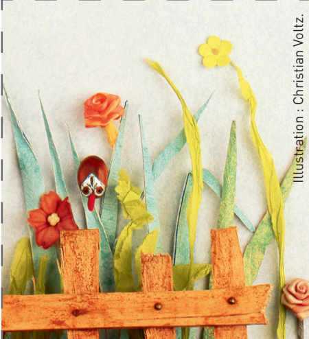
Illustration : Christian Voltz.