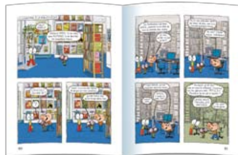
Agnès Perrin, PIUFM (Université Joseph Fourier, Grenoble)

● Voici un exemple d'activité à conduire à partir des pages 80-81 de la bande dessinée Ariol du numéro 387 de J'aime lire : Enlever la bulle 2 des vignettes 1, 2 et 3 page 80 ; la bulle 1 de la vignette 2 page 81 ; la bulle 3 de la vignette 4 page 81. Valider les choix des élèves par une lecture du texte. Faire justifier par un prélèvement d'indices dans le texte ou dans l'image.