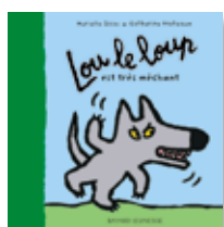
LOU LE LOUP Murielle Szac, Catherine Proteaux (Bayard Jeunesse).

Les aventures de Lou le loup sont initialement publiées chaque mois dans le magazine Tralalire sous forme d'une planche comprenant 7 vignettes numérotées. Cette mise en page particulière constitue un pas vers la bande dessinée. Par ailleurs, les élèves peuvent retrouver sept albums (ciselés pour les mains des plus petits) réunis dans un cube. Il est intéressant de travailler avec ces deux supports différents pour installer la connaissance du personnage, la notion de série et favoriser l'appropriation des objets à lire par la manipulation.