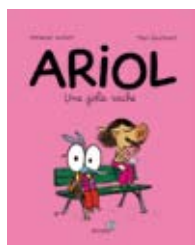
ARIOL Emmanuel Guibert, Marc Boutavant (Bayard BD).

Le personnage d'Ariol est un ânon plutôt sympathique, figure enfantine, qui évolue dans le monde d'aujourd'hui. Comme Sempé et Goscinny avec le petit Nicolas, Emmanuel Guibert et Marc Boutavant sont parvenus à recréer symboliquement l'image d'Épinal de l'enfance d'une époque (le XXI e siècle).