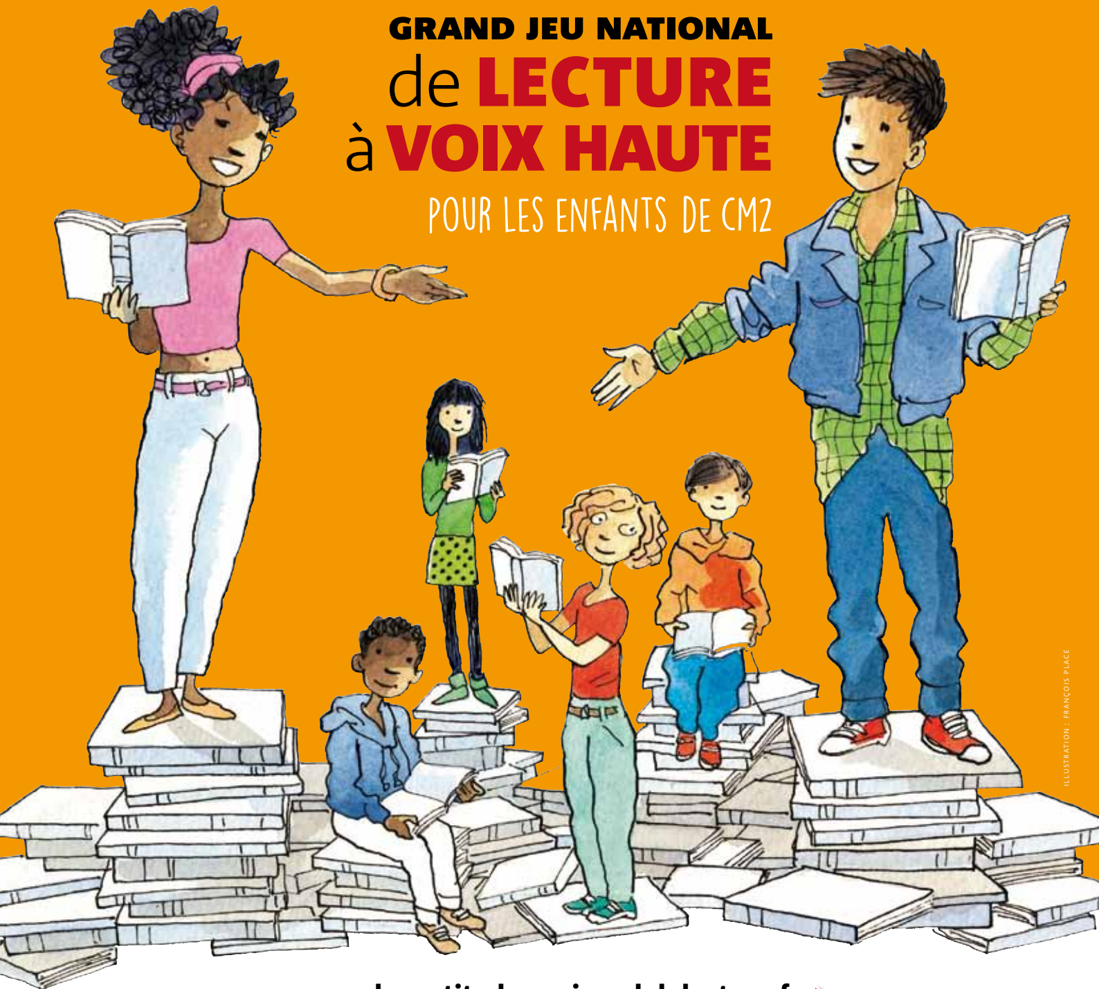
ILLUSTRATION : FRANÇOIS PLACE