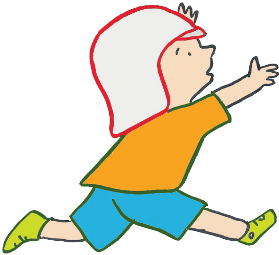
Illustration : Gilles Eduar.