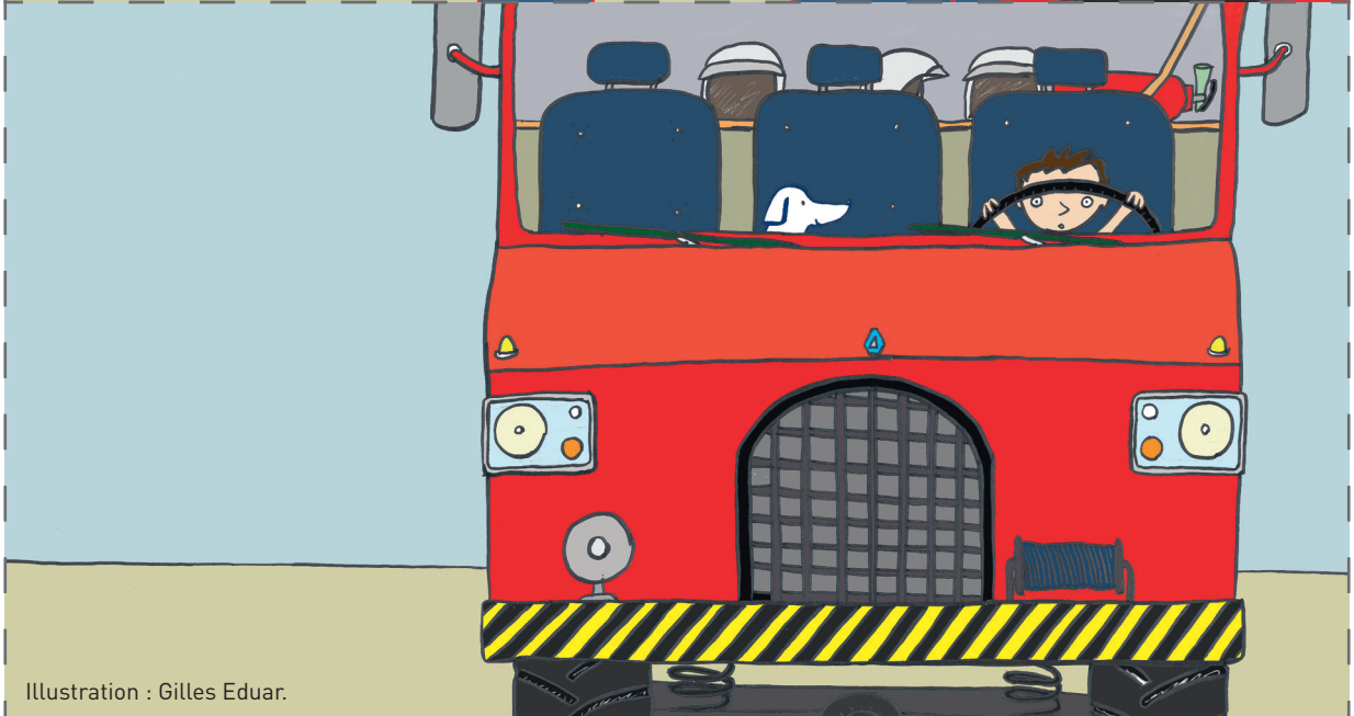
Illustration : Gilles Eduar.