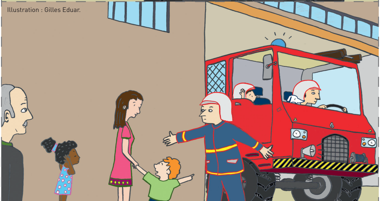
Illustration : Gilles Eduar.