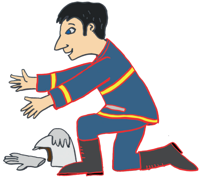
Illustration : Gilles Eduar.