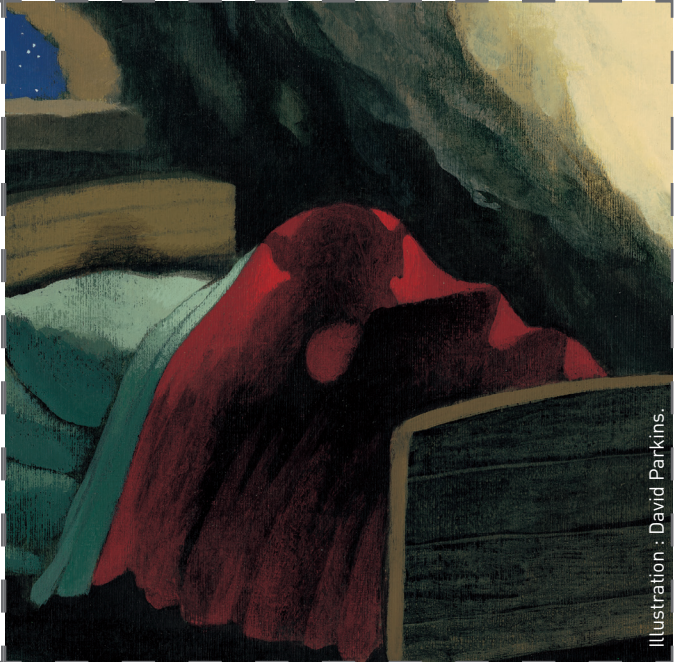
Illustration : David Parkins.