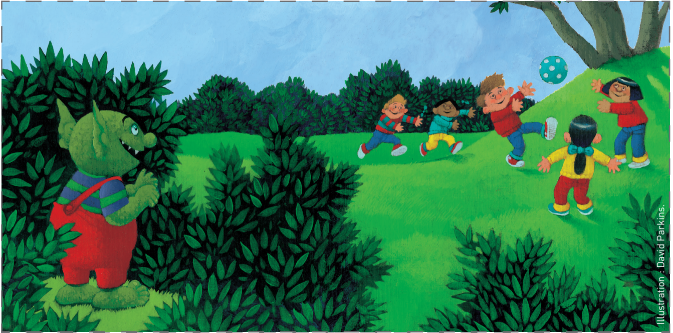
Illustration : David Parkins.