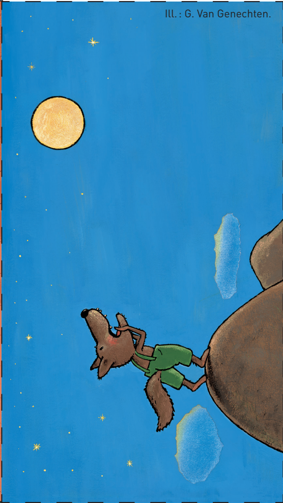
ILL. : G. Van Genechten.