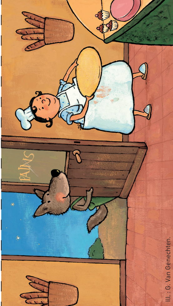
ILL. : G. Van Genechten.