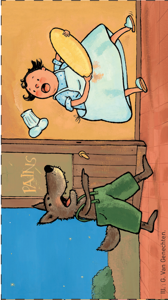
ILL. : G. Van Genechten.