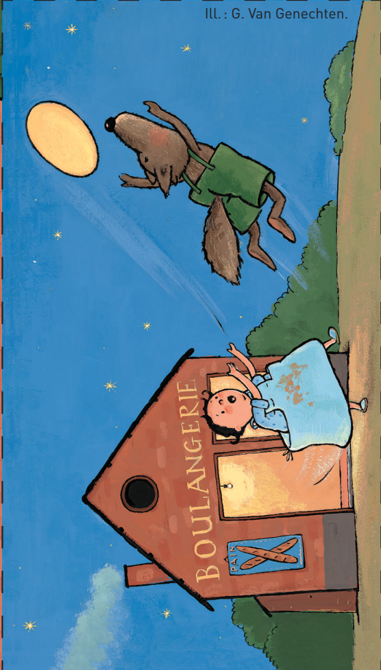
ILL. : G. Van Genechten.