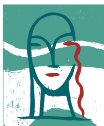
Le feuilleton d'Hermès, auteur : Murielle Szac, illustrateur : Jean-Manuel Duvivier, Bayard Jeunesse